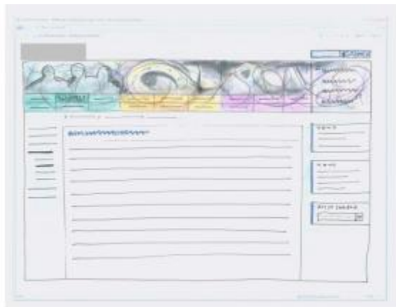
von der ersten Skizze...

SharePoint lässt sich beliebig gestalten, wie eine Website. Falls SharePoint jedoch ein Bestandteil der täglichen Arbeit wird, ist es wichtig, dass alle SharePoint-typischen Funktionen ähnlich aussehen. Beispielsweise sollte die Suche weiterhin oben rechts liegen und Listen in SharePoint sollten fast identisch aussehen wie im Standard. Hier ein Beispiel einer umfangreichen Gestaltung: