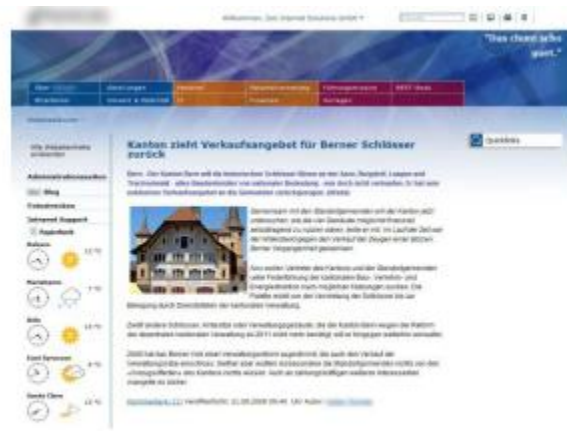
...zum realisierten SharePoint Layout